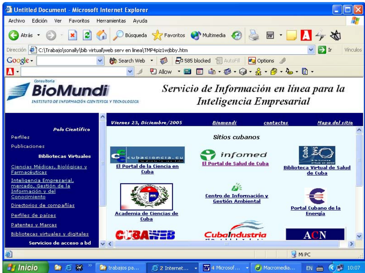
Figura 1 Vista de la página inicial del sitio

El marco izquierdo de esta página principal del sitio contiene: